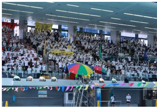
四社啦啦隊竭力為運動健兒打氣