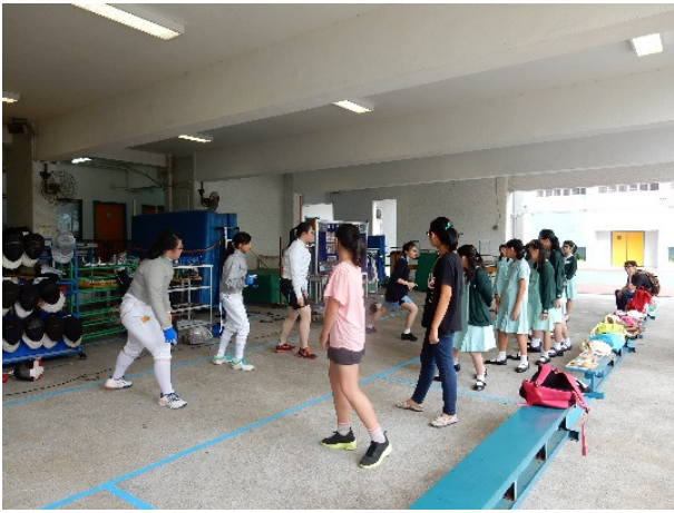
小學生一嚐劍擊滋味