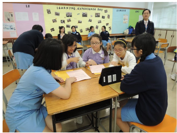
一起嘗試以電子工具學習英語