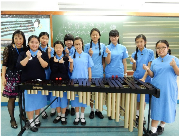
真光學生認為此活動有助提升自信心